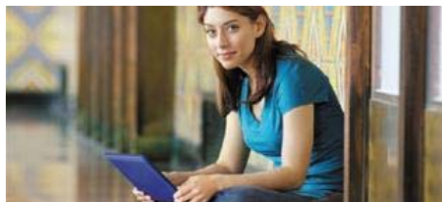
Las españolas ligan más por Internet que las británicas y francesas EUROPA PRESS

Un estudio realizado por la compañía Mobifriends, un servicio para conocer gente nueva a través de la Red, establece que actualmente "la mujer española ha evolucionado tanto que también lo ha hecho en la manera de relacionarse y buscar pareja".